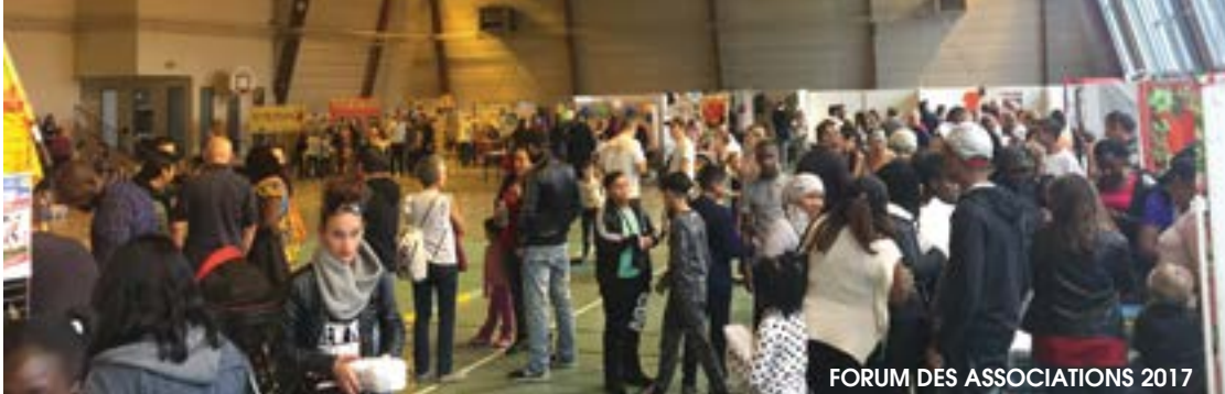
FORUM DES ASSOCIATIONS 2017